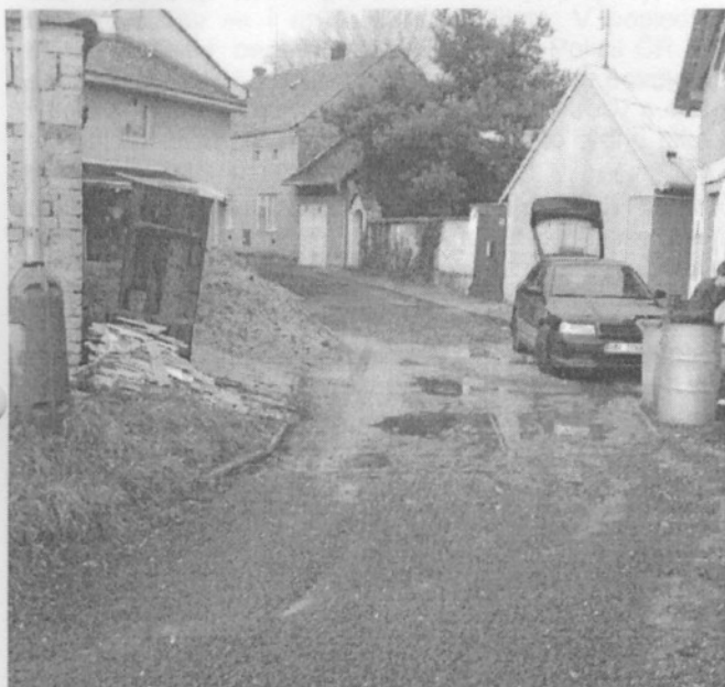
Ulice U Náhonu před rekonstrukcí

Oprava oplocení u naší školy je jistě v očích občanů podrobována kritice, proč se s touto akcí začalo tak pozdě. Jen pro vysvětlení. Obec požádala o dotaci třista tisíc korun z Programu obnovy venkova v lednu letošního roku, ale pro velký počet žadatelů jsme ji nedostali. Jedním z důvodů bylo také to, že jsme již v minulých letech z tohoto programu dostali dotace na tělocvičnu. V polovině měsíce října nám ovšem byla krajským úřadem tato dotace nabídnuta (některé obce totiž přidělenou dotaci do konce roku z tohoto programu nevyčerpají). Podmínkou ovšem je, že akce bude dokončena a vyúčtována v roce 2007. Proto jsme neprodleně zahájili přípravu a začali s opravou. Počasí nám sice nepřeje, ale dodavatelská firma je přesvědčena, že akce bude dokončena včas.